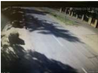
Rákóczi utca sorompó felé