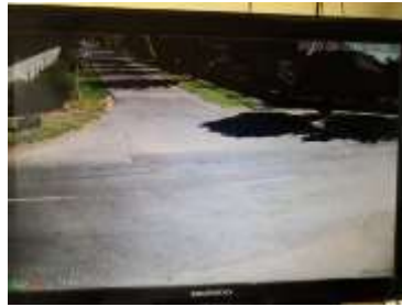
Rákóczi utca Kinizsi utca ker.