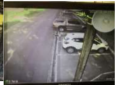
Hivatal hátsó bejárata