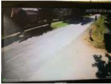
Rákóczi utca Erdei tér Tó felé