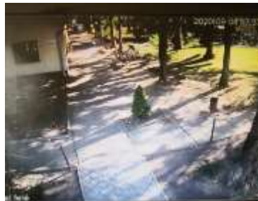
Rákóczi utca Jókai u. felé