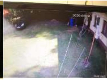
Hivatal bejárat belülről